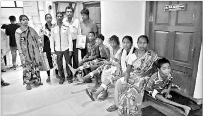
ବାସ୍ତବ୍ୟ ପକ୍ଷରୁ ଦିବ୍ୟାଙ୍ଗ ଶିଶୁଙ୍କ ସହାୟତା ପାଇଁ ପଦକ୍ଷେପ ନିଆଯାଉଛି।

ଷ୍ଟିଲ ସିଟିରେ ଦିବ୍ୟାଙ୍ଗଙ୍କ ସମସ୍ୟା ନେଇ ଏକାଧିକ ଅନୁଷ୍ଠାନ କାର୍ଯ୍ୟ କରୁଛି। ତେବେ ସ୍ୱତନ୍ତ୍ର ଭାବେ ଚିକିତ୍ସା ସହାୟତା ନେଇ ଆଗକୁ ଆସିଛି ବାସ୍ତବ୍ୟ ନାମକ ଅନୁଷ୍ଠାନ। ବିଶେଷକରି ଦିବ୍ୟାଙ୍ଗ ଶିଶୁଙ୍କ ନିଶ୍ଚିତ୍ ଅସ୍ତ୍ରୋପଚାର ଓ ଚିକିତ୍ସା ସହାୟତା ଯୋଗାଇ ଦେବା ଏହାର ମୁଖ୍ୟ ଲକ୍ଷ୍ୟ ପାଲଟିଛି। ଏମାନେ କିପରି ଆତ୍ମନିର୍ଭରଶୀଳ ହୋଇ ସମାଜର ମୁଖ୍ୟ ସ୍ରୋତରେ ସାମିଲ ହେବେ ସେନେଇ ସଙ୍ଗଠନ ପକ୍ଷରୁ ଗୁରୁତ୍ୱାହାରା ଦିଆଯାଉଛି। ଏ ଦିଗରେ କେତେଜଣ ସମଭାବପୂର୍ଣ୍ଣ ଡାକ୍ତର ଓ ସାମାଜିକ କର୍ମୀ ଆଗଭର ହୋଇଛନ୍ତି। ଷ୍ଟିଲ ସିଟି ଓ ଏହାର ପାଶ୍ଚାତ୍ୟ ଅଞ୍ଚଳର ଦିବ୍ୟାଙ୍ଗ ଶିଶୁ ଚିକିତ୍ସା ନେଇ ଗତ ମଇ ଶେଷ ଭାଗରେ ଏକ ଶିବିର ଆୟୋଜନ କରାଯାଇଥିଲା। ଅସ୍ତ୍ରୋପଚାର ଆବଶ୍ୟକ ପରୁଥିବା ଦିବ୍ୟାଙ୍ଗ ଶିଶୁଙ୍କୁ ଗତ ୯ ଏପ୍ରିଲରେ ନାଗପୁର ଠାରେ ଥିବା ଏକ ସ୍ୱତନ୍ତ୍ର ଚିକିତ୍ସା କେନ୍ଦ୍ରକୁ ପଠାଯାଇଥିଲା। ସଫଳ ଅସ୍ତ୍ରୋପଚାର ପରେ ୧୫