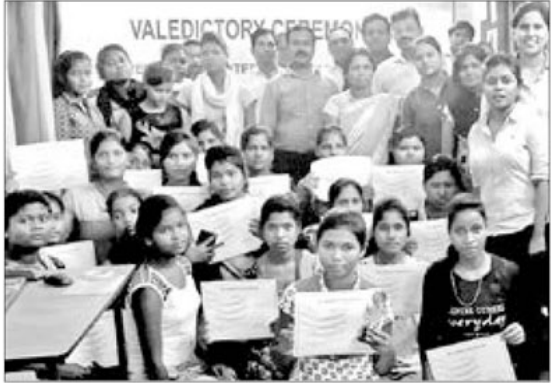
ବେଦାନ୍ତ କମ୍ପ୍ୟୁଟର ସାକ୍ଷରତା କାର୍ଯ୍ୟକ୍ରମରେ ପ୍ରଶିକ୍ଷଣ ଓ ଅତିଥିମାନେ।

ସଂପ୍ରତି ବେଦାନ୍ତ କମ୍ପାନୀ ପକ୍ଷରୁ ଏଥିରେ ପ୍ରାୟ ୪୫ହ ଛାତ୍ରାଛାତ୍ରୀଙ୍କୁ ଝାରସୁଗୁଡ଼ା ଜିଲାର ୩ଟି ସ୍ଥାନରେ ଏହି ନିଶ୍ଚଳ କମ୍ପ୍ୟୁଟର ଶିକ୍ଷା ପ୍ରଦାନ କାର୍ଯ୍ୟକ୍ରମ ପରିଚାଳନା କରାଯାଇଛି। କରାଯାଇଛି।