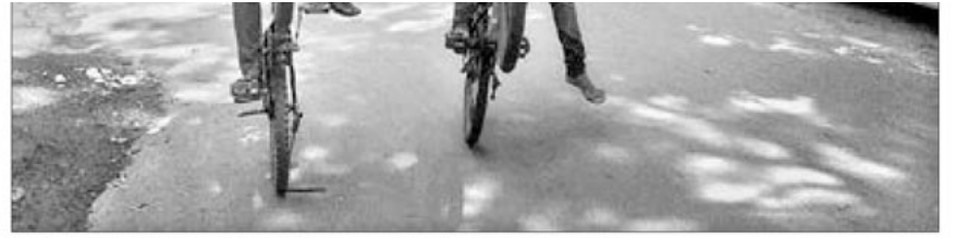
ରାଉରକେଲା ସହର ସେକ୍ଟର ୨୨ ପୁଞ୍ଜ୍ୟ ରାସ୍ତାରେ ଶନିବାର ଦୁଇଭଣ ବାଳକ ପାଇକେଲରେ ଝୁଝି କରୁଛନ୍ତି ।