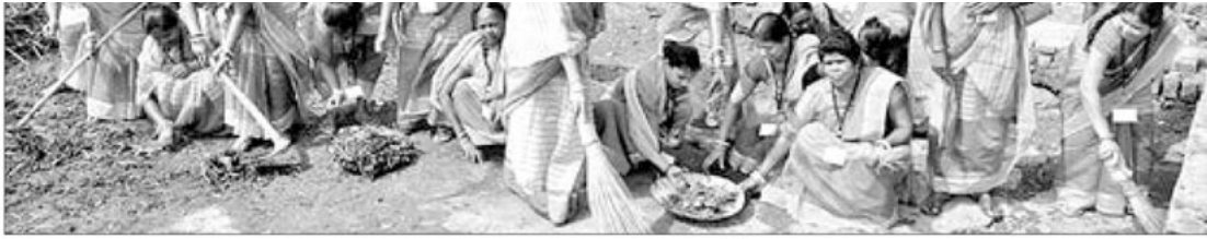
ଶନିବାର ସମ୍ବଲପୁର କ୍ଷେତ୍ରରାଜପୁର ନୂଆପଡ଼ା ଘାଟରେ ଚେକସ ମହିଳା ସଂଘର ସଭ୍ୟାମାନେ ସଫେଇ କରୁଛନ୍ତି ।