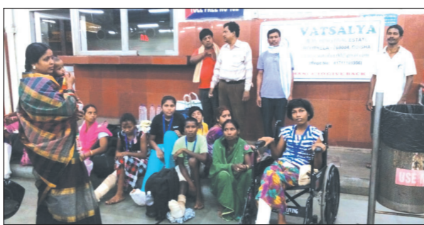
ଏହି ସହାୟତା ପିଲାଙ୍କ ସହିତ ସେମାନଙ୍କ ଅଭିଭାବକଙ୍କ ପୂର୍ଣ୍ଣରେ ସହ ପ୍ରଦାନ। କେତେକ ସମାଜବାଦୀମାନେ ଡାକ୍ତର ଓ ବୁଦ୍ଧିଜୀବୀଙ୍କୁ ନେଇ ଗଠିତ ଏହି ଟ୍ରଷ୍ଟ ଏହିଭଳି ପିଲାଙ୍କ ସେବା ପାଇଁ ପ୍ରତିଶ୍ରୁତିବଦ୍ଧ ବୋଲି କୁହାଯାଇଛି।